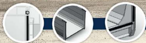
NUEVO SISTEMA DE CIERRE DE GOMA Y MARCO